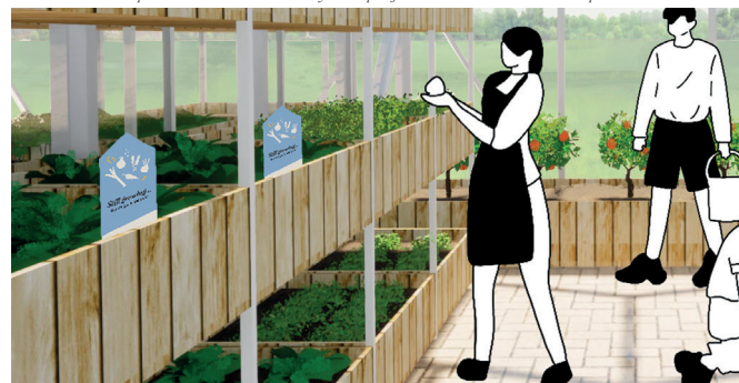
Héloïse Mariani / YomFolks / Du jardin à l'assiette : inciter les jeunes générations à avoir une alimentation plus équilibrée