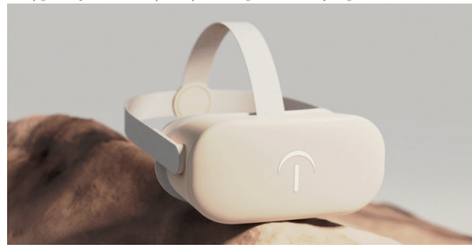
Charles Simon / Transphere / Service de communication asynchrone pour favoriser le lien entre l'astronaute et ses proches